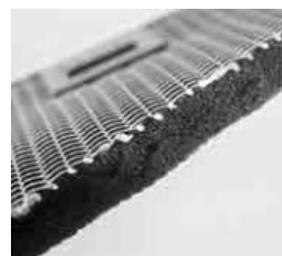
tukový filter s polyuretánovou výplňou

Elica vďaka svojmu inovatívnemu prístupu neustále posúva svoje hranice, čoho dôkazom je aj nový hliníkový tukový filter s polyuretánovou výplňou. Oproti filterom GFA dosahujú tieto filtre výrazne vyššiu účinnosť filtrácie pri rovnakých podmienkach. Spôsob čistenia je zhodný s tukovými filtermi GFA a GFI.