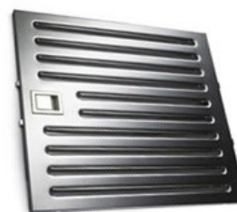
tukový filter PROFESSIONAL BUFFLE

Tukové filtre PROFESSIONAL BUFFLE sú kompletne z nerezu. Použitím filtrov PROFESSIONAL BUFFLE dodáme odsávaču industriálny výzor. Vďaka labyrintu oceľových vrstiev má veľkú účinnosť zachytávania tukov. Pri zabezpečení pravidelnej údržby si zachováva svoju účinnosť a životnosť počas celej životnosti odsávača.